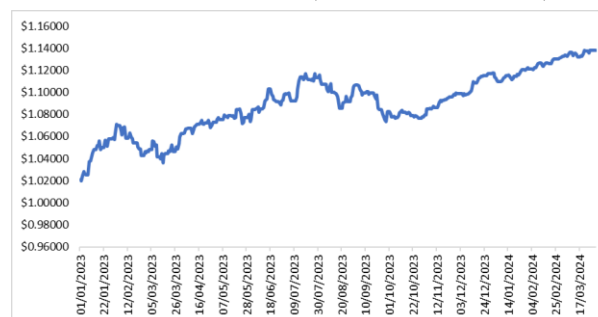
Evolución del valor cuota (enero 2023 – marzo 2024)